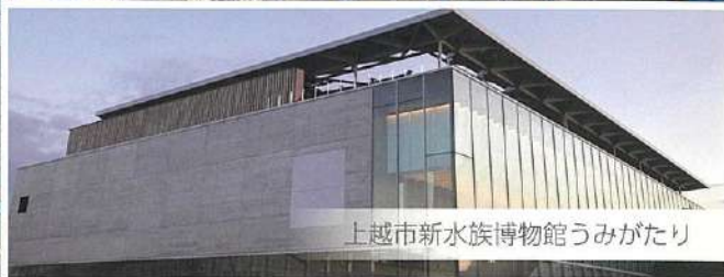
上越市新水族博物館うみがたり