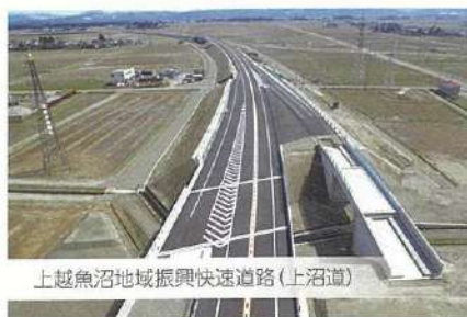
上越魚沼地域振興快速道路(上沼道)

くらしを便利するとともに災害などから地域を守る土木事業、街の機能を高め安心して利用できる施設や構造物を生み出す建築事業。舗装・重機・車輜・骨材部門の組織力を結集し、豊かな地域づくりの一翼を担うべく業務を推進しています。