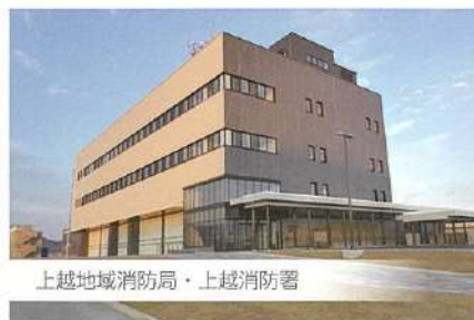
上越地域消防局・上越消防署